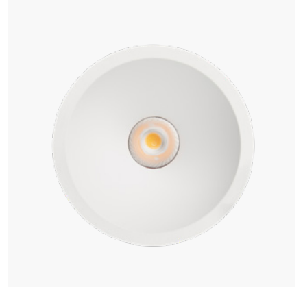
FOTO PRODUCTO. PRODUCT PICTURE