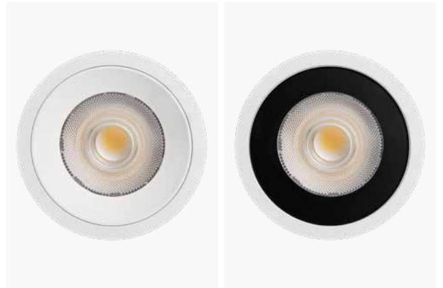
FOTO PRODUCTO. PRODUCT PICTURE