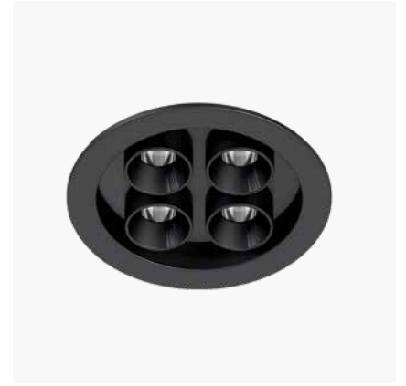
FOTO PRODUCTO. PRODUCT PICTURE