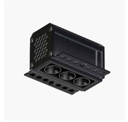
FOTO PRODUCTO. PRODUCT PICTURE