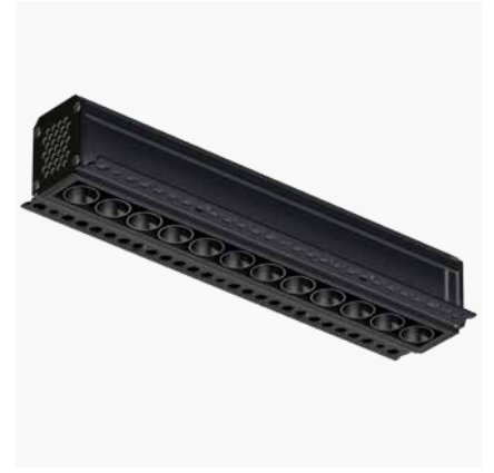
FOTO PRODUCTO. PRODUCT PICTURE