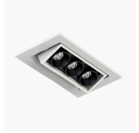
FOTO PRODUCTO. PRODUCT PICTURE