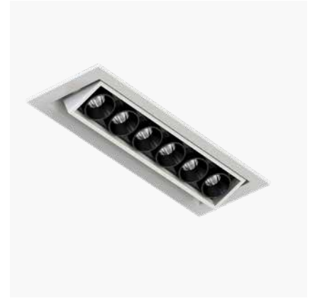
FOTO PRODUCTO. PRODUCT PICTURE