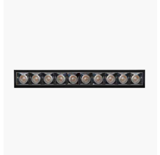
FOTO PRODUCTO. PRODUCT PICTURE