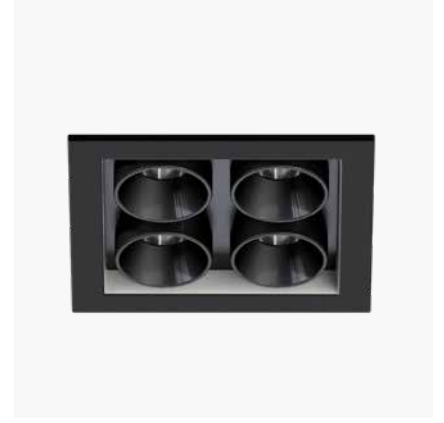
FOTO PRODUCTO. PRODUCT PICTURE