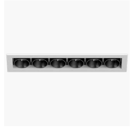
FOTO PRODUCTO. PRODUCT PICTURE