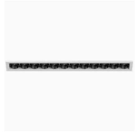
FOTO PRODUCTO. PRODUCT PICTURE