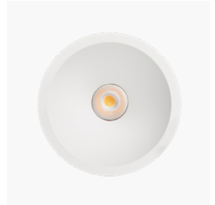
FOTO PRODUCTO. PRODUCT PICTURE