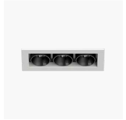
FOTO PRODUCTO. PRODUCT PICTURE