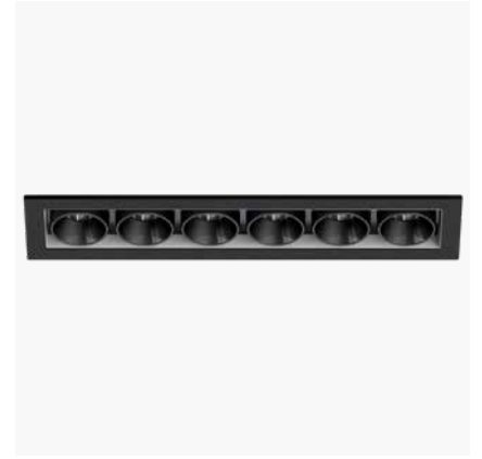
FOTO PRODUCTO. PRODUCT PICTURE