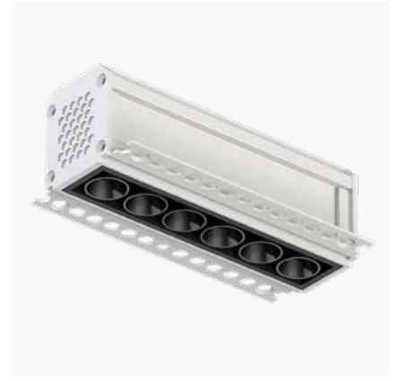
FOTO PRODUCTO. PRODUCT PICTURE