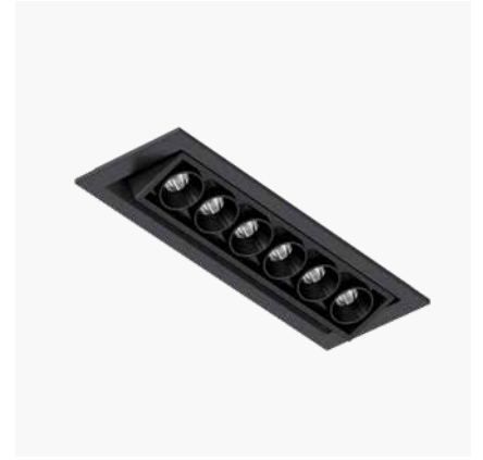
FOTO PRODUCTO. PRODUCT PICTURE