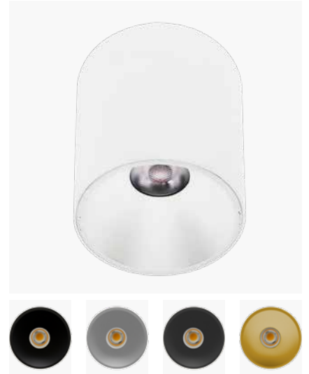
FOTO PRODUCTO. PRODUCT PICTURE