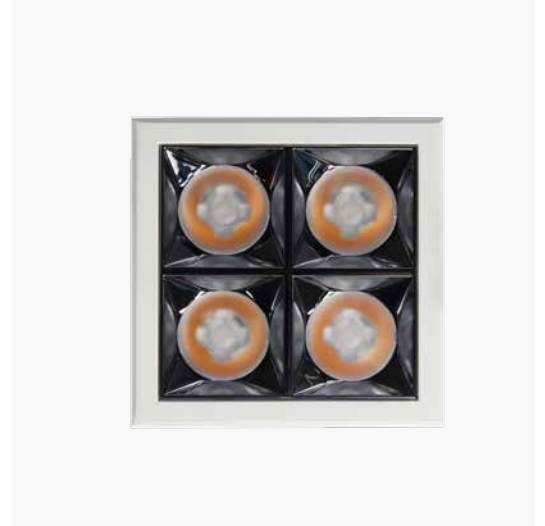
FOTO PRODUCTO. PRODUCT PICTURE